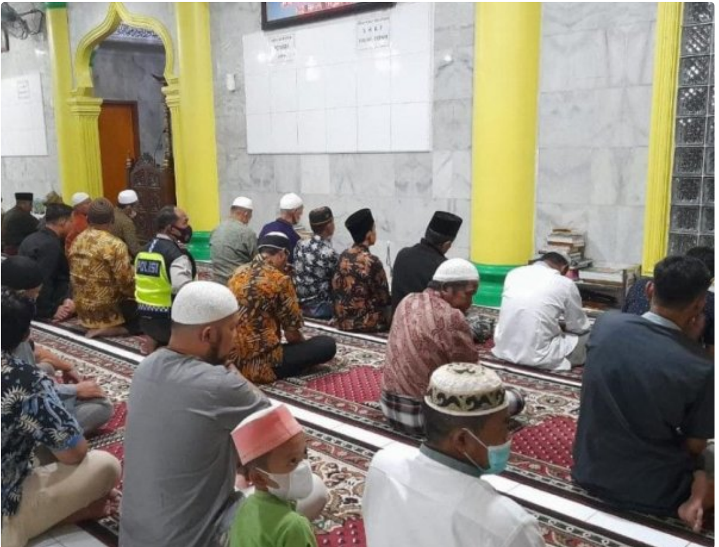
Dokumentasi Shalat Tarawih Pertama Tahun 2022 yang lalu

SUMUT-Pemerintah Republik Indonesia telah menetapkan 1 Ramadhan 1445 Hijriah jatuh hari Selasa, 12 Maret 2024 dan keputusan tersebut disampaikan